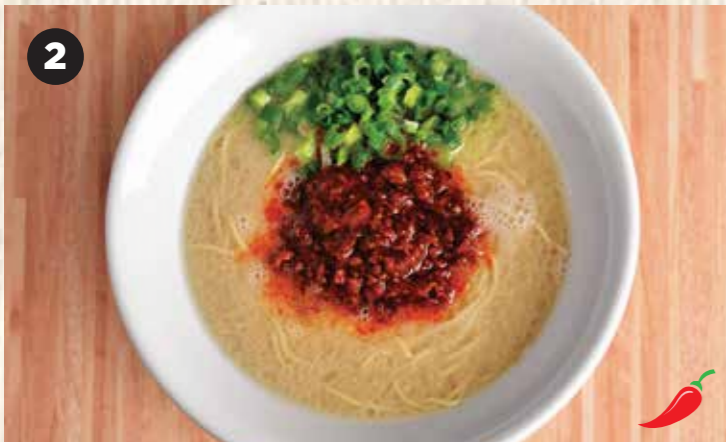
2 HAKATA SPICY $10 博多スパイシー 博多辣味豚骨拉面