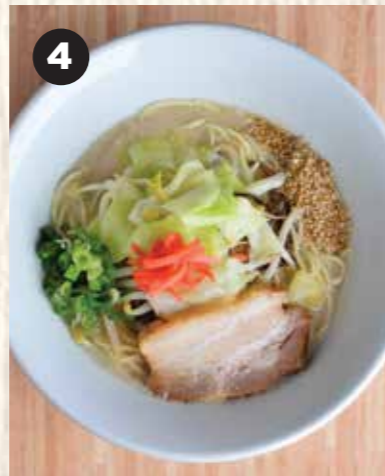
4 HAKATA TANMENYASAI 博多タンメン野菜 博多煨蔬菜豚骨拉面