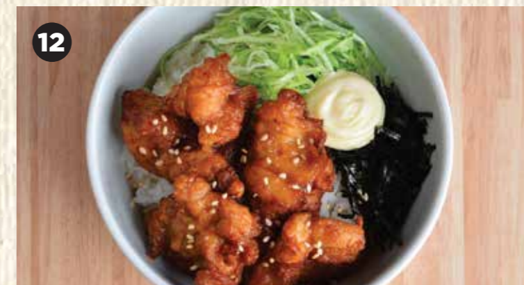
12 KARAAGE DON $8.50 唐揚げ丼 香脆炸鸡块饭