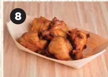
8 KARAAGE 唐揚げ 香脆炸鸡块 3PCS $5 5PCS $8