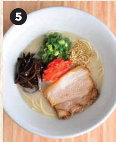
5 HAKATA TONKOTSU 博多豚骨 博多豚骨拉面