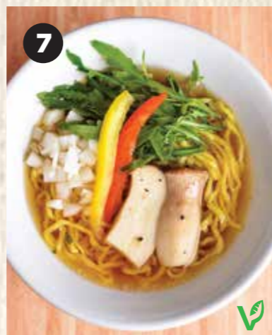
7 VEGGIE RAMEN ベジラーメン 蔬菜拉面