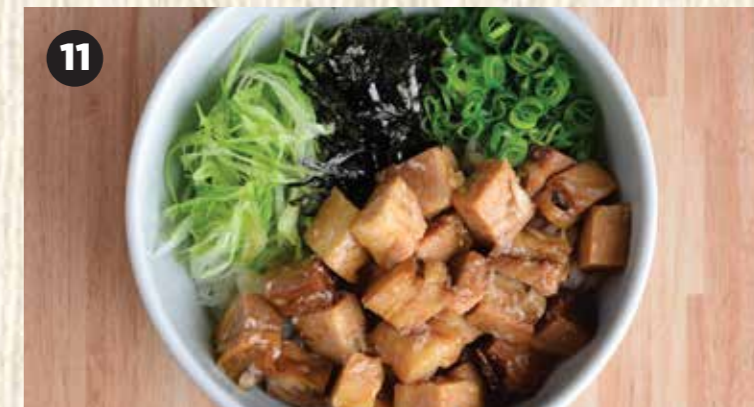
11 CHASHU DON $9.50 チャーシュー丼 日式叉烧饭