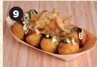
9 TAKOYAKI タコ焼き 章鱼烧 4PCS $5 8PCS $8