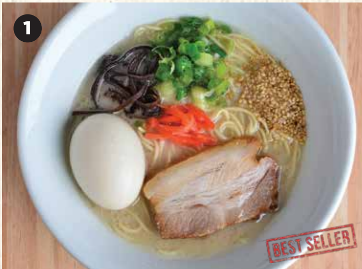
1 HAKATA TAMAGO $11 博多玉子 博多鲜味豚骨拉面