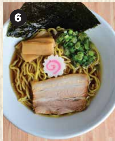
6 SHOYU RAMEN 醤油ラーメン 日本酱油拉面