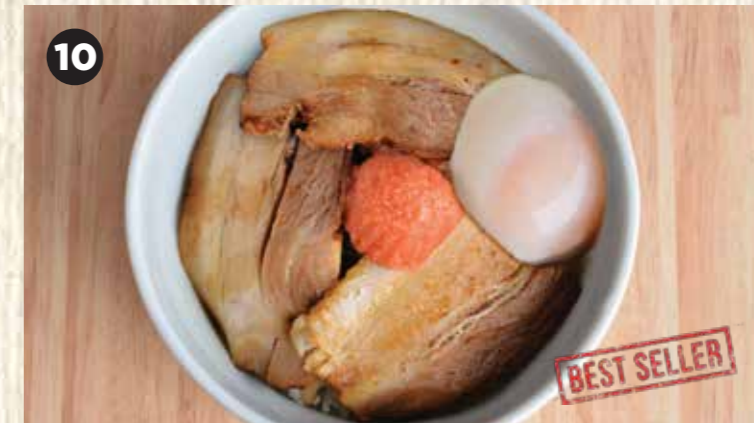
10 HAKATA NO CHIKARA MESH $10.50 ハカタノチカラ飯 博多叉烧配明太子和温泉蛋饭